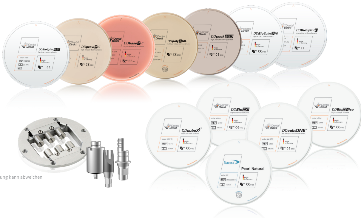
Darstellung kann abweichen